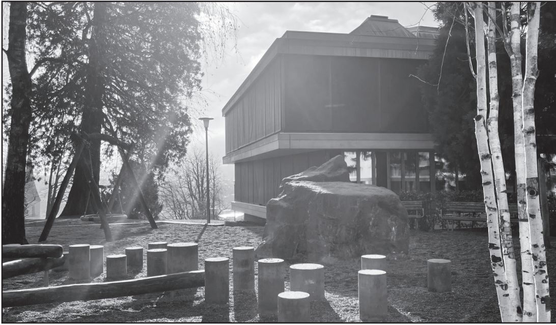
Aktiv sein im Freien: Das können die Kinder auf dem Pausenplatz im Felsberg.