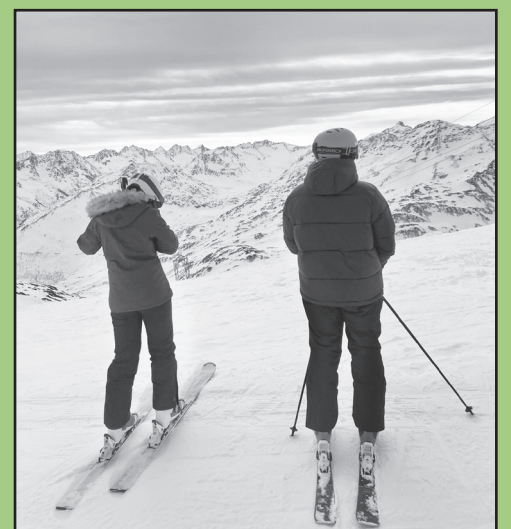
Weitblick: Skiferien in Disentis - Sedrun.