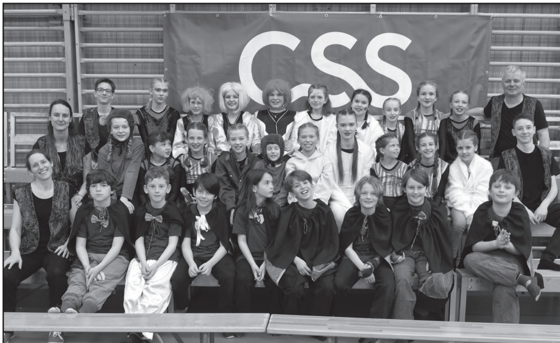
Der Kinderzirkus Caramelli findet jeweils in einer Osterferienwoche statt: Mitmachen können interessierte Kinder ab der 3. bis zur 6. Klasse.