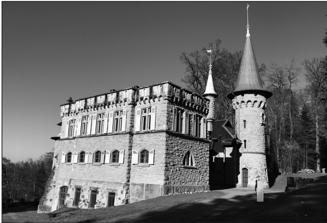
Der Dreilindenpark: Während vier Tagen wird gespielt, improvisiert und gestaltet.