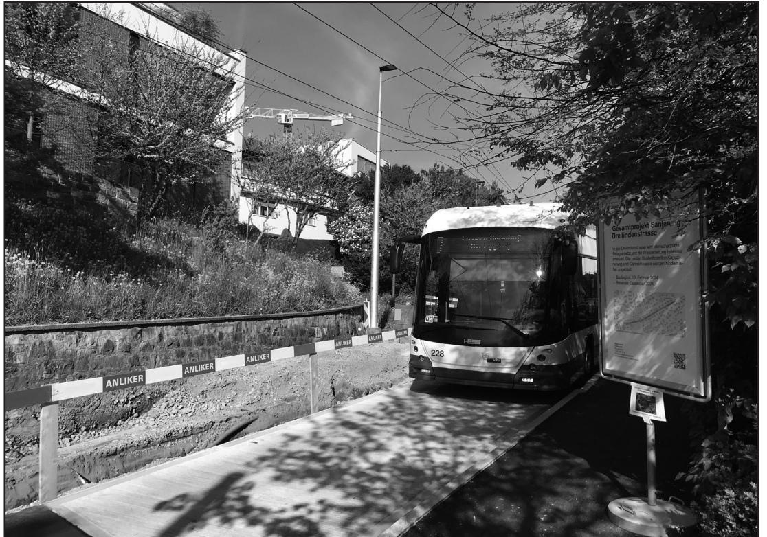
Bushaltestelle Kapuzinerweg: Hier ist ein ebenerdiges Einsteigen für Personen mit Mobilitätseinschränkungen bereits möglich, die Bauarbeiten auf der anderen Strassenseite sind noch im Gang.

Momentan sind die meisten Bushaltekanten nur zwischen sechs und elf Zentimeter hoch und verstossen gegen das Gesetz. Bei rund 160 Haltekanten war dies Anfang 2023 der Fall, heisst es auf der städtischen Website. In der ganzen Stadt sind bis 2029 Umbauarbeiten an 73 Haltekanten