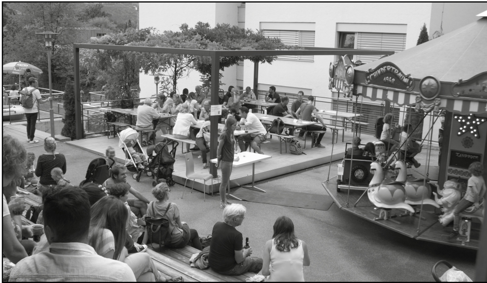
Ein gelungener Chilbi-Tag in der Kinder- und Jugendsiedlung Utenberg.