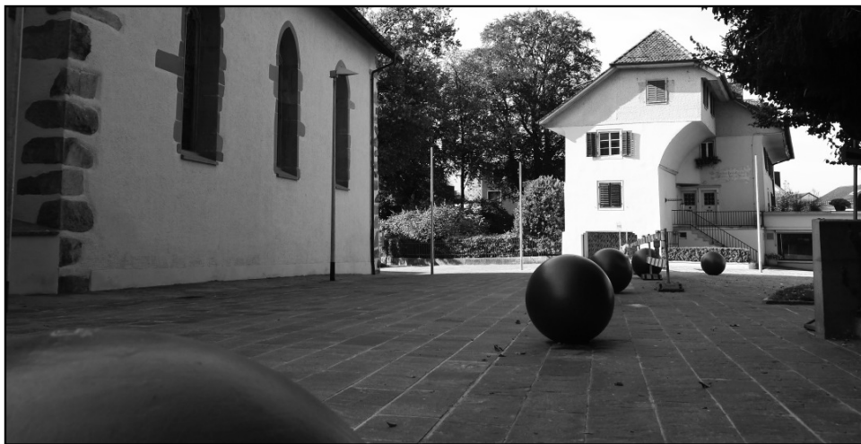
Die Steinplatten auf dem Klosterplatz wurden komplett ersetzt.