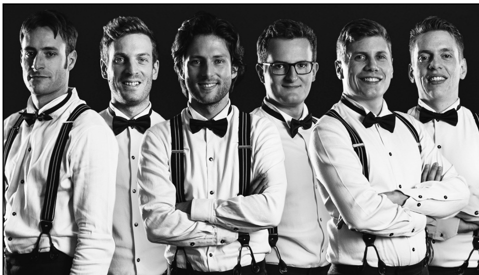
Vor 10 Jahren gegründet: Vier der sechs A-cappella-Sänger haben ihre Wurzeln im Wesemlinquartier