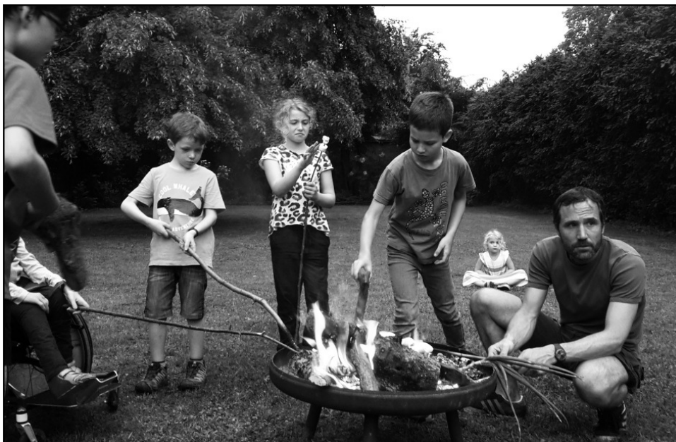
Die Familiengärtner sind regelmässig im Einsatz: Am Gartenfest kam auch das Bräteln nicht zu kurz.

Der Einsatz für Gerechtigkeit, Friede, Bewahrung der Schöpfung, kurz GFS, gilt als Herzstück der Spiritualität des Franz