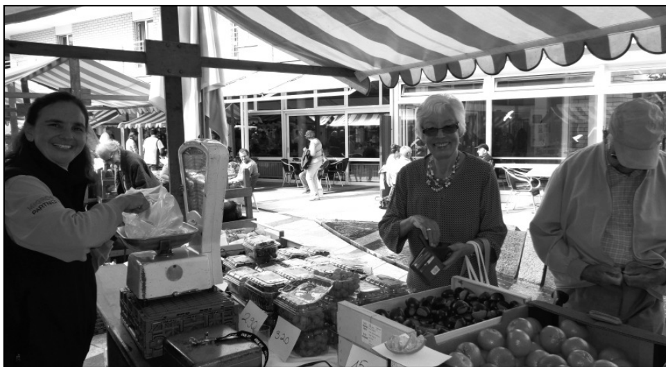
Herbstliche Auslagen an den Marktständen beim Viva Luzern Wesemlin.