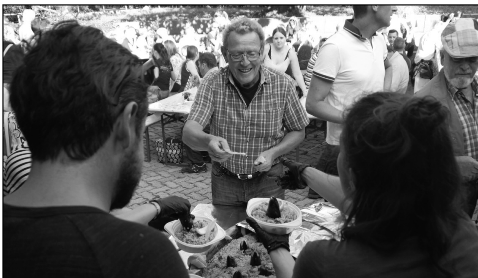
Grossaufmarsch am Abend beim Träff: Die Paella am Quartier-Znacht fand reissenden Absatz.