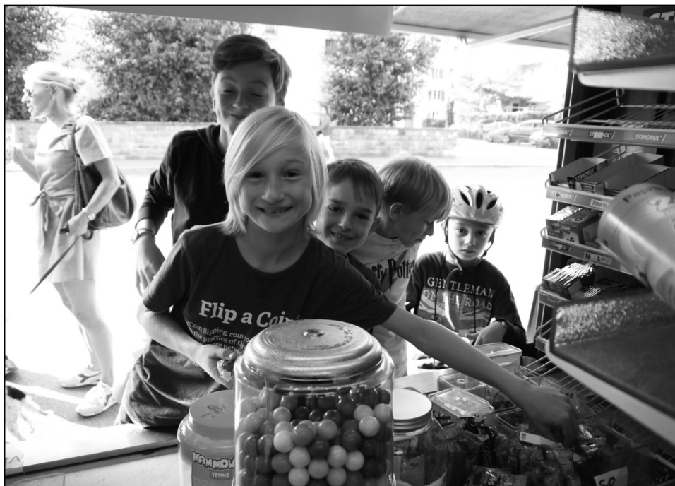
Die Quartier-Kids freuten sich: Am Schluss gab es die Süßigkeiten mit Spezialrabatt.