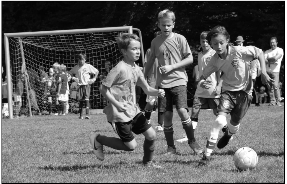
Voller Einsatz: Das Turnier auf dem Gartenheimplatz fand zum 40. Mal statt.

Ein Schiedsrichter-Entscheid gab dieses Jahr speziell zu reden. Er sorgte auf dem Spielfeld für grosse Emotionen und sicherlich beim anschliessenden Quartier-Znacht für einigen Gesprächsstoff. Im Halbfinal der Männer zwischen den Pfstengöttern und dem