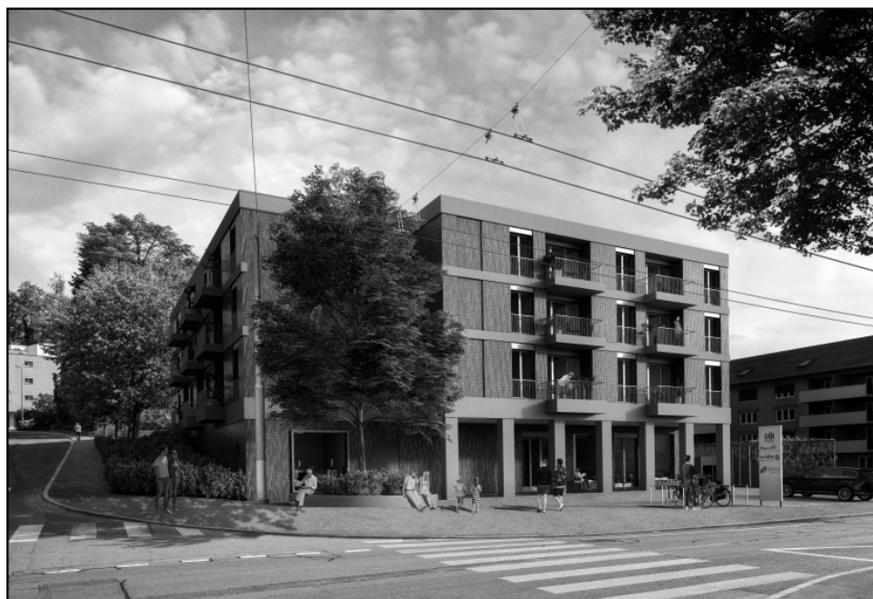
Der neue „Wäsmeli-Träff“: Die Bauarbeiten sollen im September 2019 starten.

Weiter gehören die Spitex sowie Vicino Luzern zu den Mietern des neuen