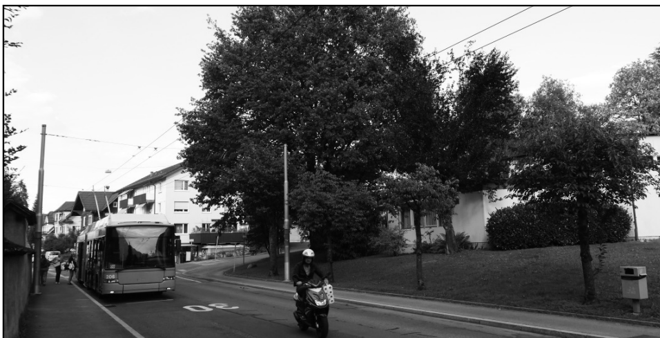
Die Jubiläums-Eiche vor dem „Wäsmeli-Träff“