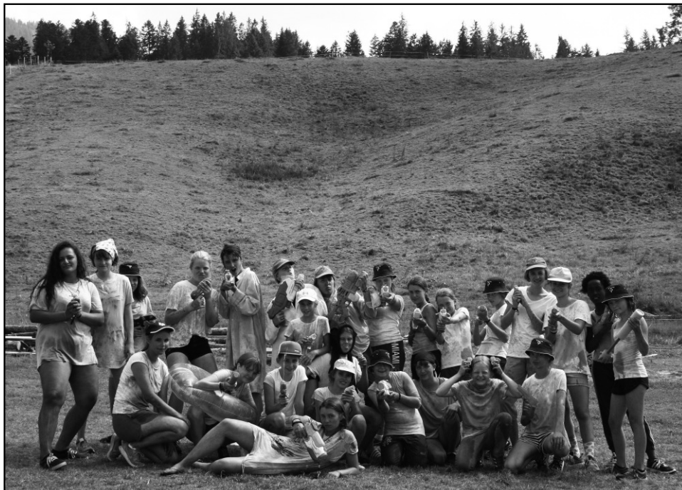
Die Pfadi Lindegar war im Kantonslager als „Vivemo“ unterwegs.