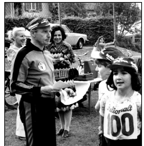
Sportanlass im Gartenheim