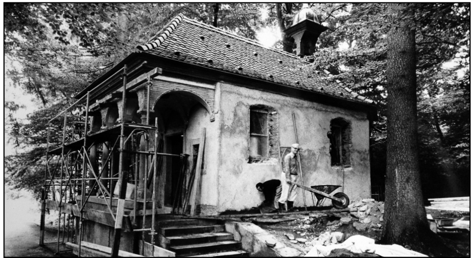
Restauration der völlig verfallenen Waldkapelle im Jahr 1978.

Es gibt sogar einen Jubiläums-Brunnen. Er trägt keine Inschrift und wirkt ganz selbstverständlich: der Brunnen auf dem Spielplatz Gartenheim. Er war aber keineswegs eine Selbstverständlichkeit. Die Aktionsgruppe Spielplatz, welche nicht nur Spielanlässe organisierte, sondern ab 1978 auch in Fronarbeit neue Holzspielgeräte evaluierte und zusammenbaute, setzte sich hartnäckig für einen